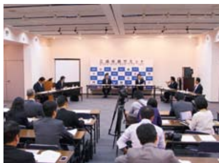
▲4回目となる今回のサミットでは、観光振興や健康増進策を議論しました

群馬県草津町。12年連続で「にっぽんの温泉100選」の第1位に輝く、名実ともに日本を代表する温泉地です。そして、葉山町にとっては国内唯一の姉妹都市。スポーツ、文化、商工、行政など様々な分野でつながり、助け合い、その友情は今年で47年目を迎えました。今年度、葉山町では草津町との「姉妹都市交流パスポート」を発行しました。心と体のリフレッシュに、草津温泉旅行に出かけてみてはいかがでしょうか。