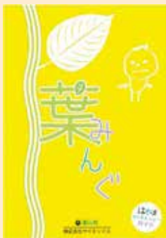
▲一昨年発行したものと