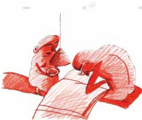
▲ミハエラ・パヴラートヴァー監督