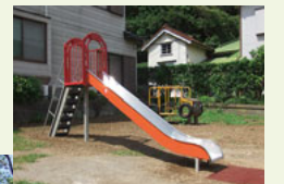
▲芳ヶ久保児童遊園 滑り台