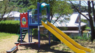
▼富士見児童遊園 コンビネーション