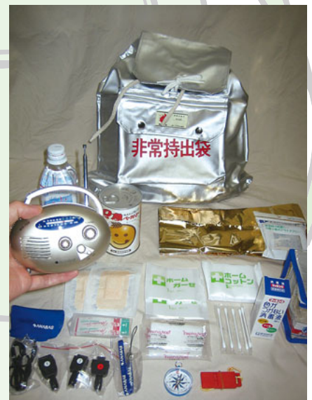
▲非常持出袋イメージ

制御することがあります。公衆電話はその制御を受けません。設置場所はNTT東日本のホームページ ( http://www.ntt-east.co.jp/ptd/index.html ) で確認できます。