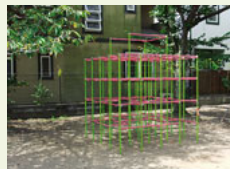
▲堀内児童遊園 ジャングルジム