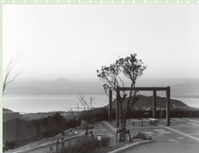
←エリックさんもお気に入りだという、富士山が見えるグリーンパーク

色々な国に行く機会も多いですが、国際村に戻ってくると穏やかな気持ちになります。この環境は自然をととても身近に感じられるため、研究するのももぴったりです。夕方にランニングをしたり、お昼休みには富士山を眺めたり。会議のために遠方から来た人にも、いつも絶賛されるほどの景色ですね。