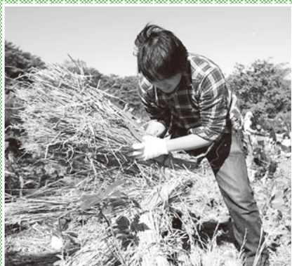
▲わらで土が流れるのを防ぐよ