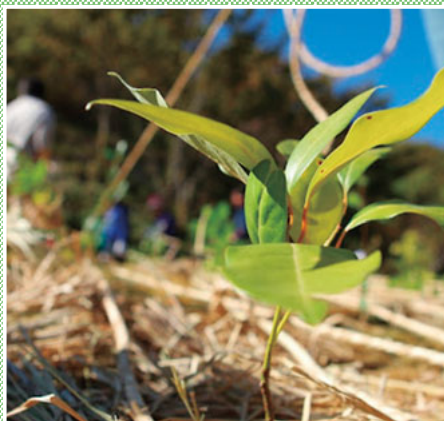
▲小さな苗が大きな木に