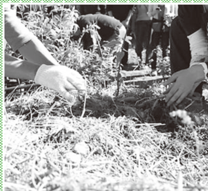
▲植える苗の種類は様々