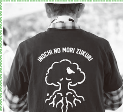
▲命の森をつくるよ