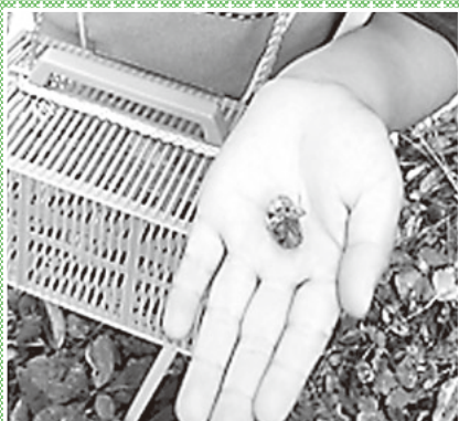
▲手の上でじっくりと観察

植樹は初めての人も小さな子どもも、手順を覚えれば簡単にできるものです。新緑の香りに包まれて、連休最後の一日をリフレッシュして過ごしてみませんか。