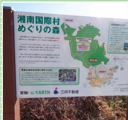
▲この看板が目印です