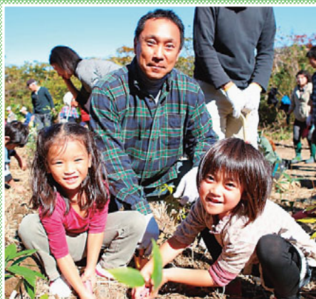
▲親子で仲良く植樹中

自然と人、人と人が出会い、森づくりにつながる様々な活動を市民・企業・行政が協働で行う。湘南国際村めぐりの森では、そのための植樹や自然とのふれあい、動物介在教育、森林活用などを行っています。今回はその中でも「22世紀へと引き継いでいける都市近郊の森づくり」を旨とした植樹、さらにはその森を拠点に、「自然とふれあい・自然に学び・自然を守り育て・自然を愛する人を育てる」ため開催している自然ふれあい楽校についてご紹介します。