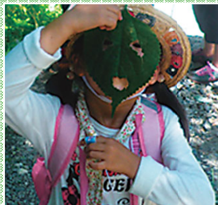
▲葉っぱで作った可愛いお面