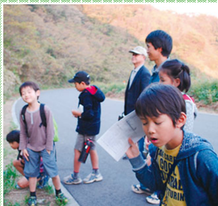
▲虫の音が聴こえるよ