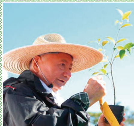
▲植樹指導者である宮脇先生