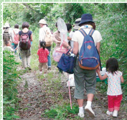
▲親子で自然の中を歩こう