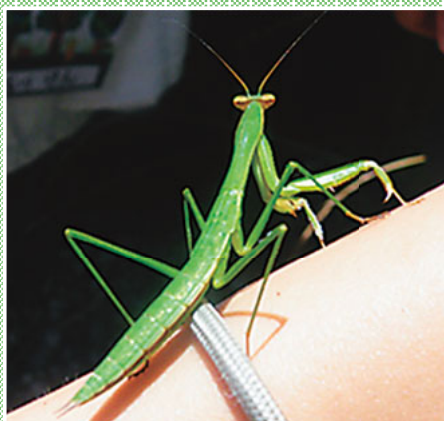
▲カマキリってどんな虫？