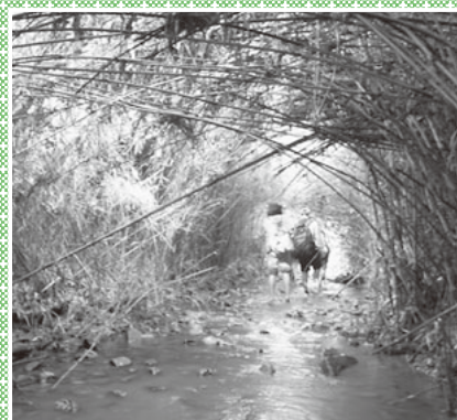
▲自分だけの発見をしよう