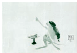
山口蓬春《河伯》制作年不詳

申込み ハガキかファックスに住所・ 氏名(ふりがな)・性別・年齢(学年)・ 電話番号を書いて、「美術体験教 室係」へ(〒240-0111一色2320)