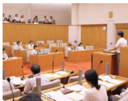
▲ 中学生議会のようすは10月号でお伝えします

平成24年末、作文コンクールで受賞した中学生が一人、町長室を訪問してくれました。当時のことは今もはっきり覚えています。それより少し前、葉山中学校が荒れているという評判が立ったことがありました。しかし、関係機関の連携で落ち着き、彼女には面談で「良かったですね」と伝えました。しかし彼女は「それは生徒たちが頑張ったからです。現場を見に来てください」と落ち着きながらも強い意志のある目でそう言うのです。