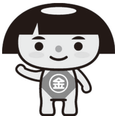
▲県のキャラクター 「かながわキンタロウ」