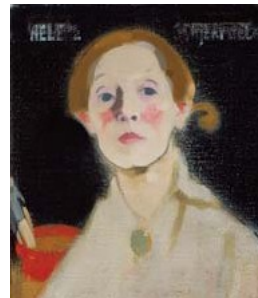
《黒い背景の自画像》 アテネウム美術館 Herman and Elisabeth Hallonblad Collection, Ateneum Art Museum, Finnish National Gallery