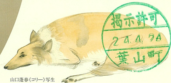
山口蓬春《コリー》写生 昭和8年(1933) 部分

主催: 山口蓬春記念館・公益財団法人 JR東海生涯学習財団 後援: 神奈川県教育委員会、葉山町教育委員会、 公益財団法人 日本野鳥の会