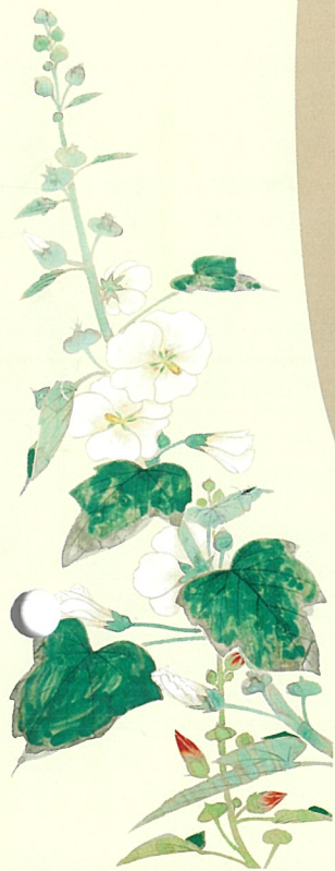
山口蓬春《立葵》 昭和8年(1933)頃 部分