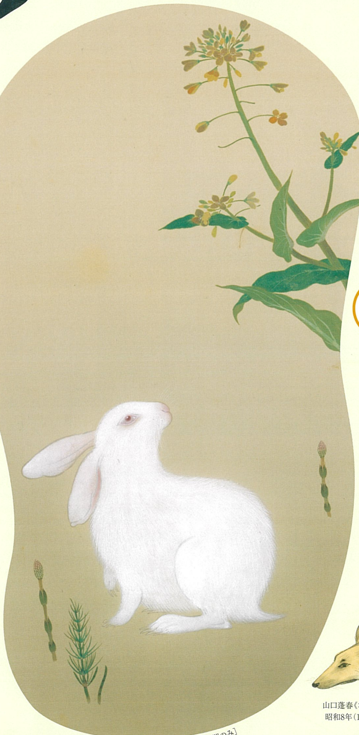
山口蓬春《春野》 昭和16年(1931) 部分[前期のみ]