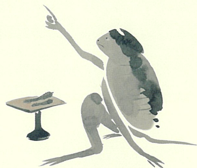
山口蓬春《河伯》 昭和時代 部分