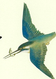
山口蓬春《首夏》 昭和4-5年(1929-30) 部分