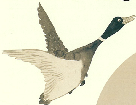
尾形光琳《飛鴨図》 江戸時代(18世紀) 部分[前期のみ]