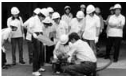
消防用ポンプ操作訓練