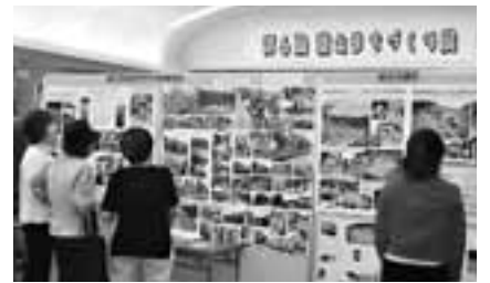
昨年の展示会場の様子