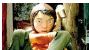
◀スージー・ テンブル トン監督 『ピーター と狼』(2006)