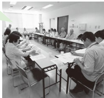
▲総会のような様子