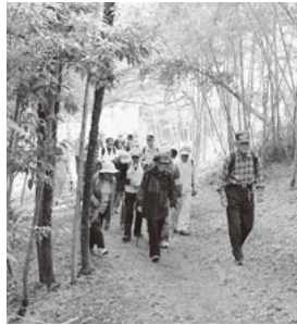
▲写真は昨年11月の高齢者秋季歩こう会