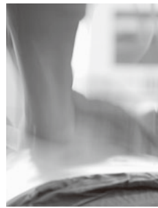
▲もしもの時に助けられるように