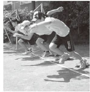
▲スポーツの基本である「ランニングの基礎」などを体験！（費用無料）