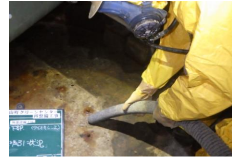
〔ごみ焼却施設除染状況〕