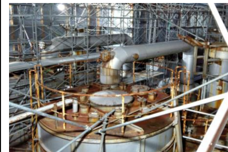
〔し尿処理施設内部状況〕