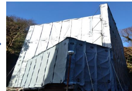
〔し尿処理施設足場設置完了〕