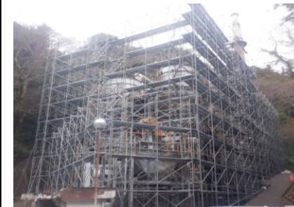
〔し尿処理施設足場設置状況〕