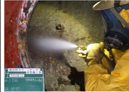
〔ごみ焼却施設除染状況〕