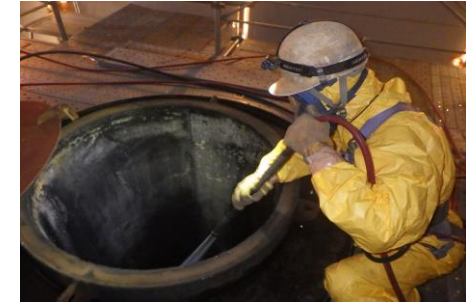
〔し尿処理施設除染状況〕