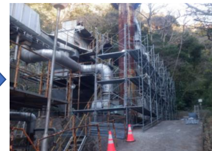
〔し尿処理施設足場設置状況〕