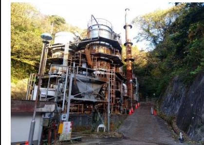
〔し尿処理施設足場設置前〕