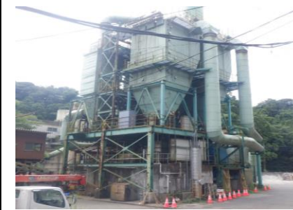
〔ごみ焼却施設足場設置前〕