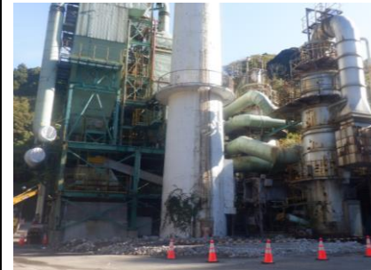
〔ごみ焼却施設足場設置前〕