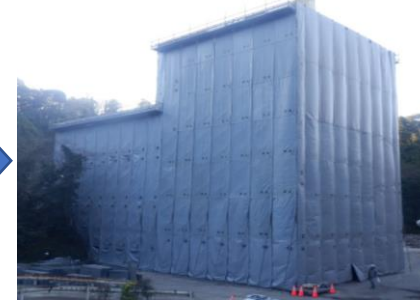
〔ごみ焼却施設足場設置完了〕