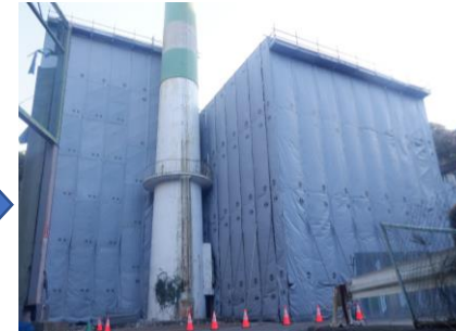
〔ごみ焼却施設足場設置完了〕