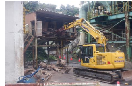
〔不燃物処理施設解体状況〕