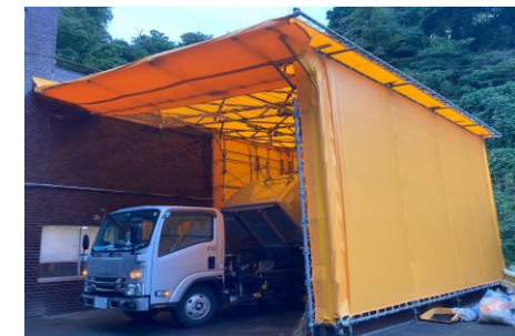
〔仮設駐車場設置完了〕