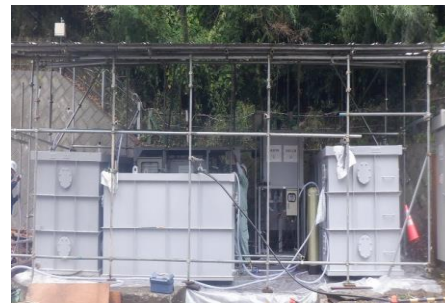
〔除染用水処理施設設置状況〕