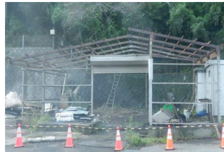
〔布団置場解体状況〕