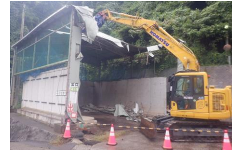
〔容器包装プラスチックヤード解体状況〕