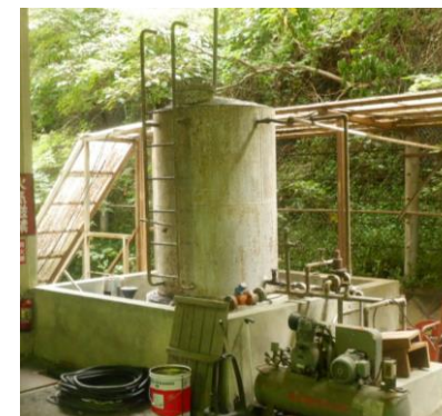
〔重油タンク撤去前〕