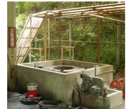
〔重油タンク撤去完了〕