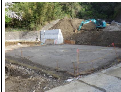
〔サテライトセンター耐圧版施工前〕