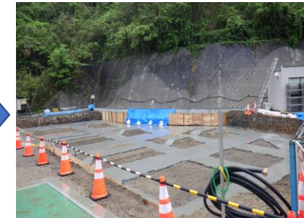
〔管理棟捨てコン打設完了〕