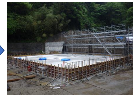
〔サテライトセンター耐圧版打設完了〕