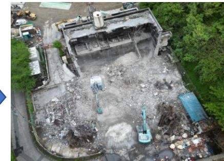
〔既設管理棟解体状況〕