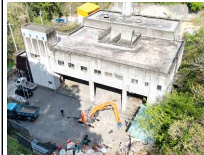
〔既設管理棟解体前〕