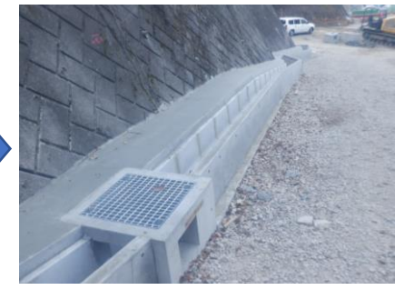
〔雨水側溝設置完了〕