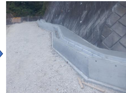
〔雨水側溝設置完了〕