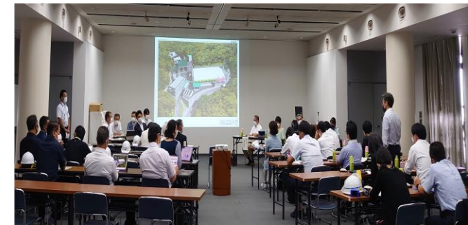
〔福祉文化会館での概要説明〕