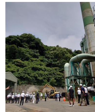
〔クリーンセンターでの視察状況〕