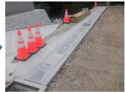
〔雨水側溝埋戻し完了〕