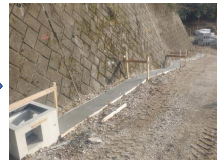
〔雨水側溝基礎コン打設完了〕