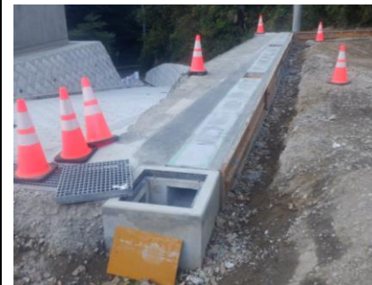
〔雨水側溝埋戻し前〕