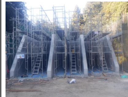
〔びん類SY足場解体前〕