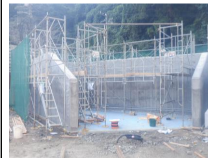
〔ペットボトルSY足場解体前〕