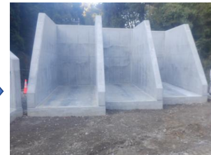
〔びん類SY足場解体完了〕