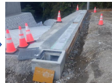
〔雨水側溝設置完了〕