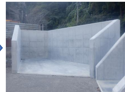
〔ペットボトルSY壁打設完了〕