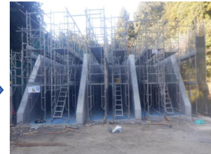
〔びん類SY壁打設完了〕