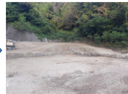
〔スロープ造成状況〕