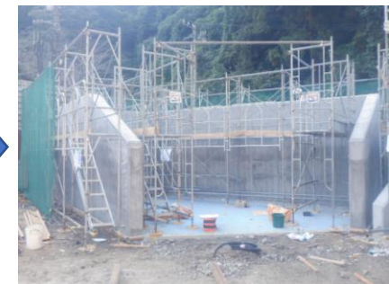
〔ペットボトルSY壁打設完了〕