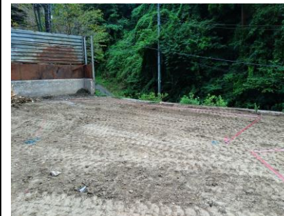
〔ペットボトルSY壁施工前〕