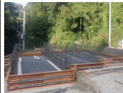
〔びん類SY耐圧版配筋完了〕