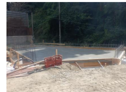
〔ペットボトルSY耐圧版打設完了〕