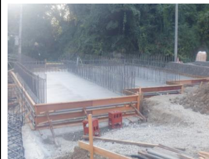
〔びん類SY耐圧版打設完了〕