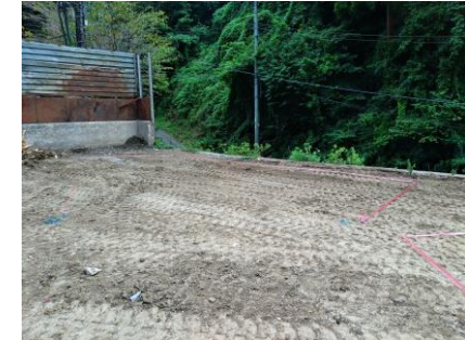
〔ペットボトルSY施工前〕