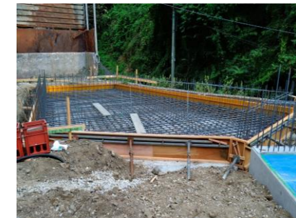
〔ペットボトルSY耐圧版配筋完了〕