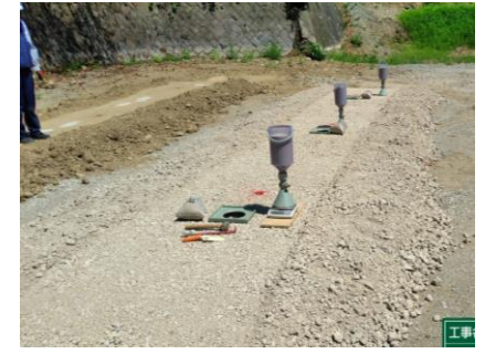
〔試験盛土砂置換状況〕