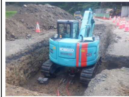
〔計量器(退場用)地耐力確認状況〕