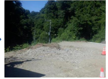
〔既設電柱撤去完了〕