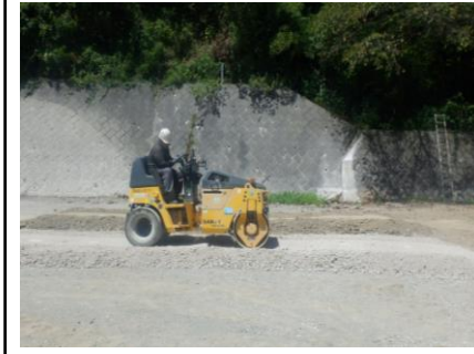
〔試験盛土転圧状況〕