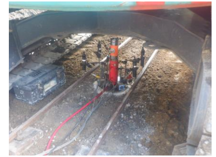
〔計量器(退場用)地耐力確認状況〕