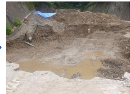
〔し尿処理施設地下水槽解体完了〕