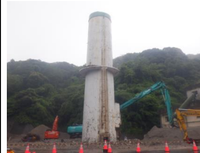
〔ごみ焼却施設煙突下部解体前〕