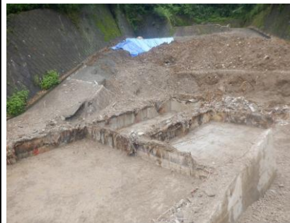
〔し尿処理施設地下水槽解体前〕