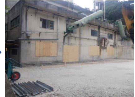
〔再生砕石敷均し完了〕