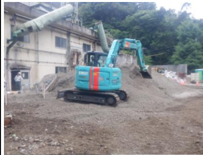
〔再生砕石敷均し状況〕