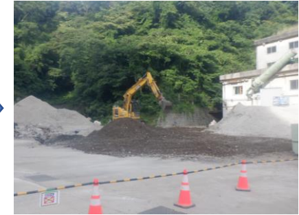
〔ごみ焼却施設煙突解体完了〕