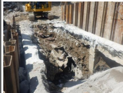
〔し尿処理施設地下重油タンク撤去状況〕