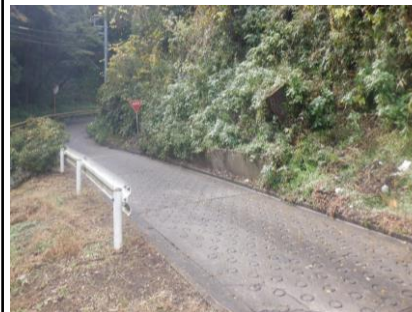
〔退出路コンクリート舗装施工前〕