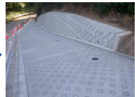
〔退出路コンクリート舗装完了〕