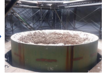
〔ごみ焼却施設煙突上部砕り完了〕