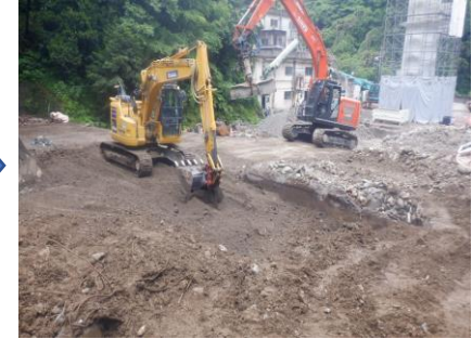
〔し尿処理施設地下重油タンク撤去完了〕