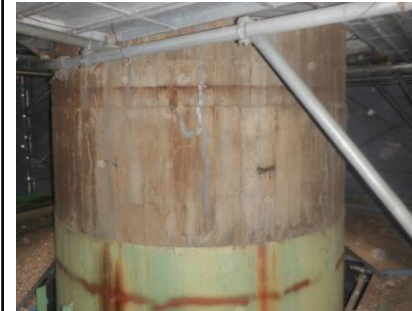
〔ごみ焼却施設煙突上部砕り前〕