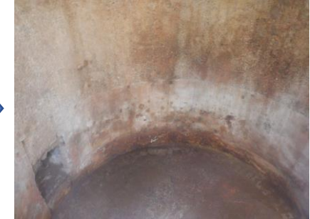
〔煙突耐火煉瓦斫り完了〕