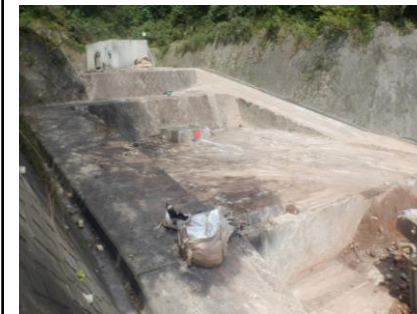
〔し尿処理施設解体前〕