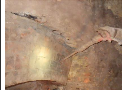
〔煙突耐火煉瓦斫り状況〕