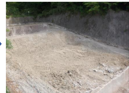
〔し尿処理施設解体完了〕