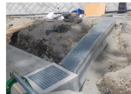
〔退出路横断側溝設置完了〕