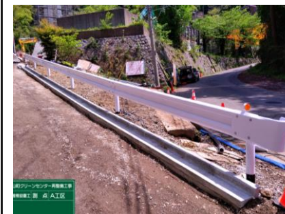
〔退出路ガードレール設置完了〕