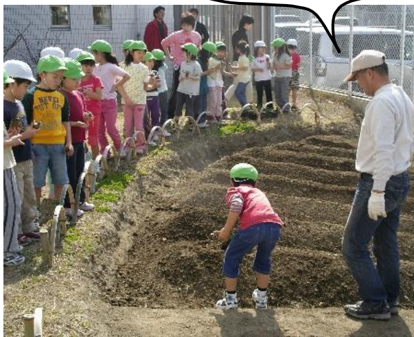
みんなでヤーコンとじゃがいもを植えました。

町立葉山保育園では、この冬から生ごみを裏庭の土に混ぜ込んで、豊かな土づくりを行っています。それを園児たちの食育にも活かそうと、ボランティアが協力して畑を作りました。そして3月の晴れた日、そこで園児たちによる芋の苗植えが行われました。「野菜が育つには何が必要なんですか？」という園児の質問に、「水と太陽と肥料。生ごみがその肥料になるんだよ」とボランティアが答えると、園児たちは目を丸くしていました。生ごみの肥料でどんなおいしい野菜ができるのか、今から待ちきれませんね。