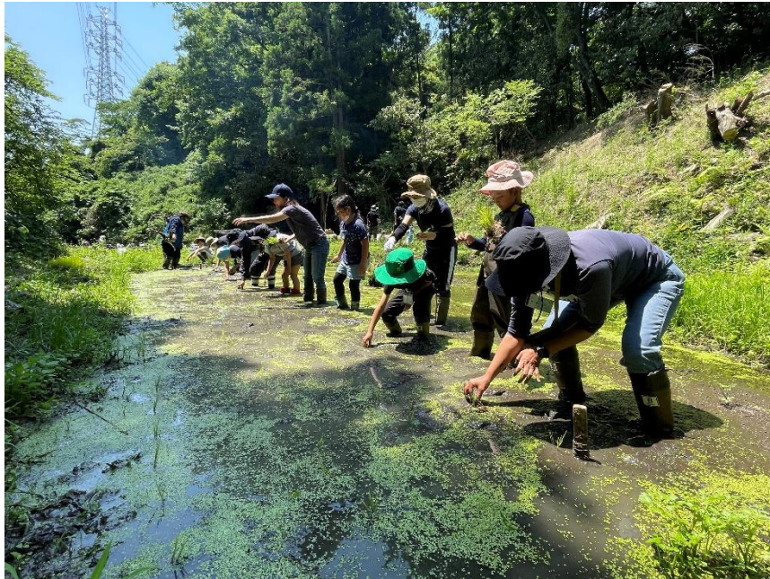
はやま里山スクール