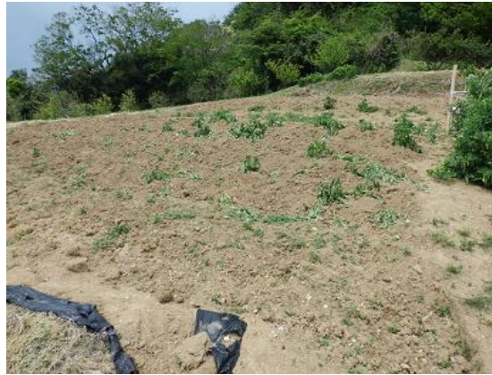
イノシシとイノシシによる農場被害（食害を受けたジャガイモ畑）