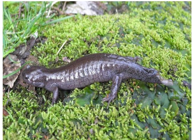
トウキョウサンショウウオ

ヤマアカガエルは水辺と森林が高い水準で満たされていないと繁殖できない種のため、近年減少が著しく、国や神奈川県のリッドデータには載っていないものの絶滅の恐れがあります。