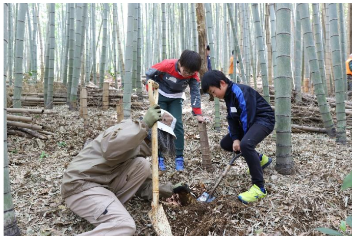
小学生を対象とした里山管理体験イベント