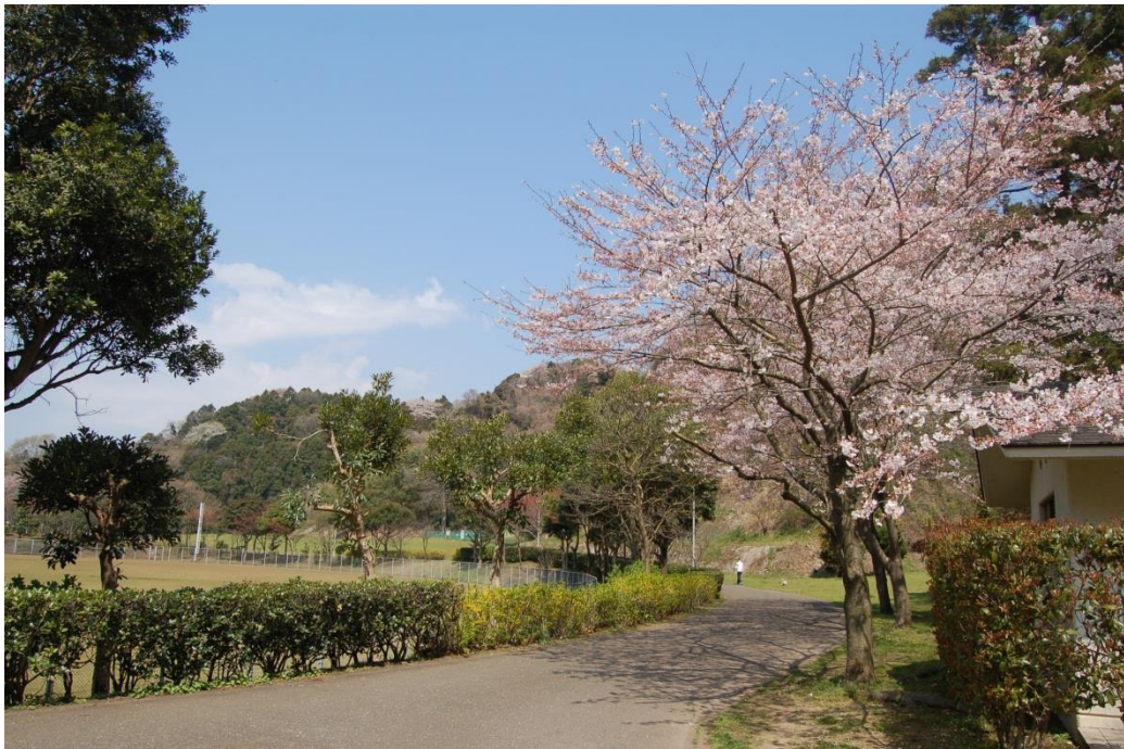
都市公園（南郷上ノ山公園）