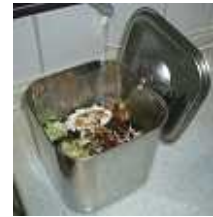
←フタ付容器。省化しないステンレス製にたどり着いたそう。