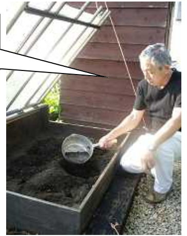
↑20cm程穴を掘って生ごみを入れた後、上に土をかぶせておけば表面はサラサラ!