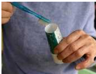
切れおままだまだ使えるんデス!

包装用ビニールはさつとよごれを落としてから捨てなければいけない、ということを知って、ある日、洗顔石けんのチューブを洗おうとはさみでまっ二つに切ってみました。そしたら、何とまだ中に沢山残っているではありませんか! 手でよく絞り出したつもりだったのに、。出口付近まで指や歯ブラシでほじほじすると4~5回分はあります。それ以来、歯磨き粉などの製品は必ずチューブを切って最後まで使い切り洗ってから捨てています♪