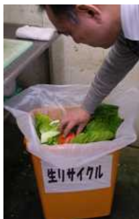
↑「ブタさんの食べ物」用の容器。