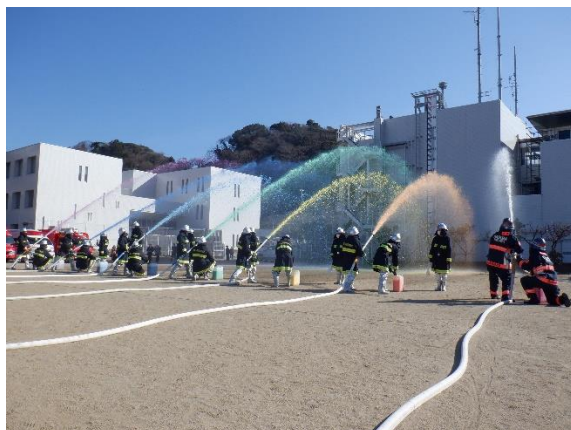
新春を飾る一斉放水