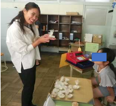
<先生もお客さんに>

9月15日(金)。杉の子学級の夏祭りが開催されました。めあては①「おねがいします」や「ありがとう」をいおう! ②やくそくやじゅんばんをまもろう! ③やさしいことばをつかおう!の3つです。お祭りのメインは杉の子の子どもたちが自ら店員を務める「おみせ屋さん」。かき氷屋さん、べっこうあめ屋さん、うめジュース屋さん、ひこうき屋さん、もぐらたたき屋さんなどのお店が大集合。「いらっしゃいませ」「おいしいよ」と元気の良い呼び込みの声とともに、多くのお客さんで賑わいました。この日は保護者の方も参加してくださったので、子どもたちはやる気満々、思い切り楽しむことができたようです。