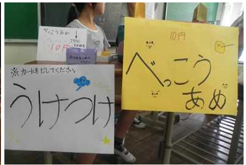
<工夫して作った受付>