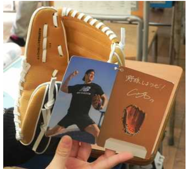
<寄贈されたグローブとメッセージカード>