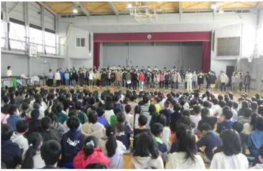
<堂々とした6年生の発表>

12月4日(月)に3年生が、6日(水)に6年生がの音楽発表会を行いました。3年生は合唱とリコーダー演奏をそれぞれのクラスが違う曲で発表しました。特にリコーダーは4月から初めて取り組んだ楽器です。指使いやタンギングなど、一音一音ていねいに練習してきた成果が表れていました。6年生は学年合唱と2クラスずつ合同での合奏の発表です。4ヶ月間にわたって練習に励み、当日は皆、自信に満ちあふれた堂々とした姿で臨むことができました。両学年とも素晴らしい発表会となりました。3学期は4,5年生の音楽発表会があります。