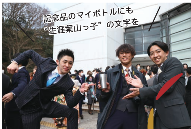
記念品のマイボトルにも “生涯葉山っ子”の文字を