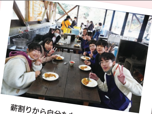
薪割りから自分たちでやりました！ (12/4～5 ジュニアリーダー養成講座)