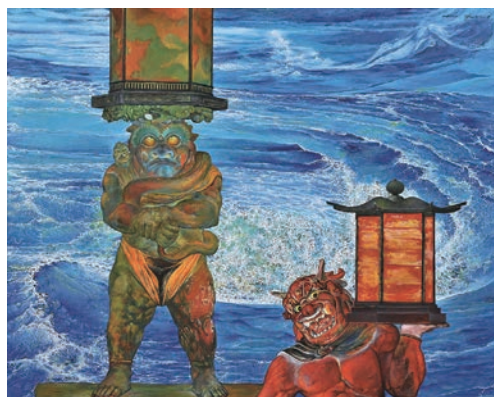
▲奥谷博《底力》2021年 油彩、カンヴァス 個人蔵