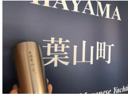
▲新成人考案の刻印入りのタンブラー

今年も同学年の8割以上の新成人が福祉文化会館に集まりました。オンライン参加の方々も多数。本当に毎年すごい出席率です。青春真っ只中の熱い若者たちと話しました。海外で活躍したい