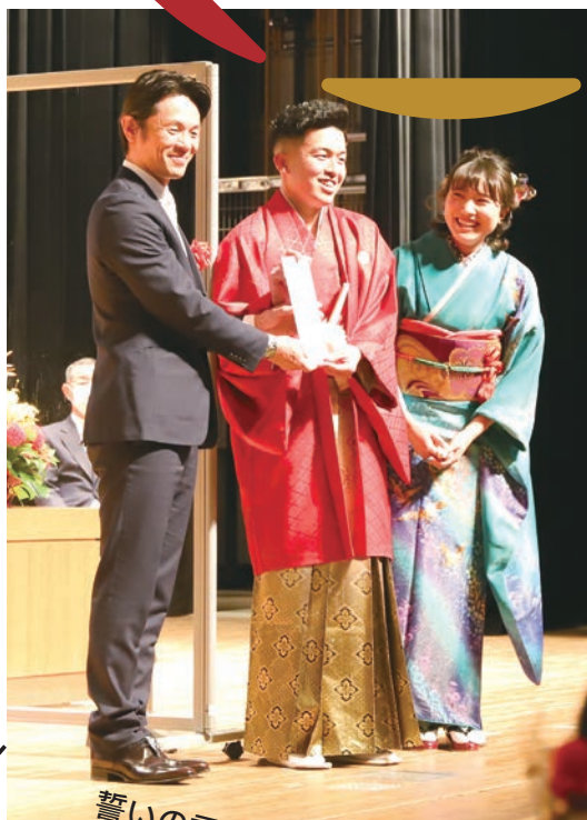
誓いの言葉は かなり悩みました!