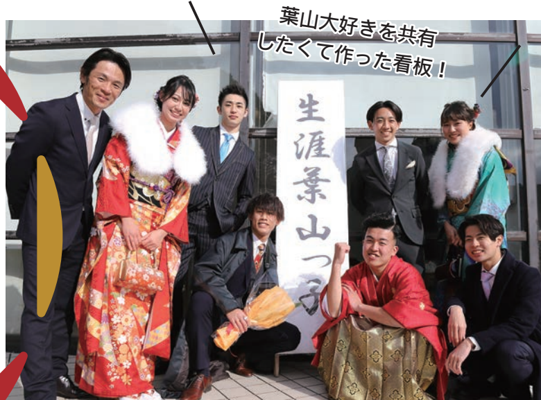
葉山大好きを共有 したくて作った看板!

今年の成人式も、葉山の小中学校に通っていた新成人が実行委員となり、式典の運営、記念品、誓いの言葉などの準備にあたりました。コロナ禍で様々な制約がある中でも、一生に一度の思い出作りのために、彼らしいこだわりを持って企画をしてくれました。