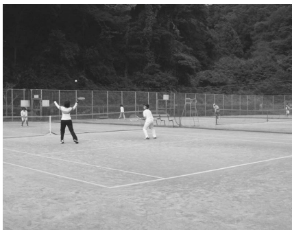
▲テニスコートの人工芝が新しくなります