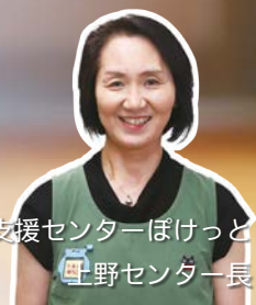
子育て支援センターほけっと 生野センター長

慌ただしい日常の中、親の思いが溢れてついつい伝えすぎてしまう…いつも保護者の皆さんと「黙って見守るのは難しいね」と話題になります。ちょっと立ち止まって、子どもの言葉や行動を信じて待つと、きっと子どもの新しい一面と出会う喜びを感じられますよ。