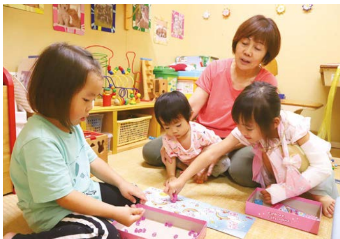
▲ 葉山にこここ保育園内にある病後児保育室どんぐり