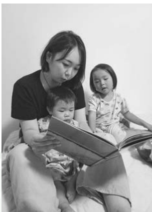
▲寝る前に「今日は絵本6冊読んでほしい」とのリクエスト。疲れていても大切にしたい時間です。