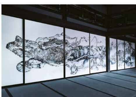
▲岡山市の最上稲荷山妙教寺「雲龍図」年に一期間（夏季大祭時）永続的に公開予定

葉山の波の美しさなどからも着想を得ています。水を司る神を描いた「雲龍図」は水の動きを緻密に具象的に描き、一方の背景の雲や嵐は、葉山の自然現象のように、墨を流動的な動きでにじませる抽象技法を用いて「具象と