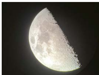
▲ 38万キロ先の月。光速で1.3秒。アームストロングが降りたのはあのへん？