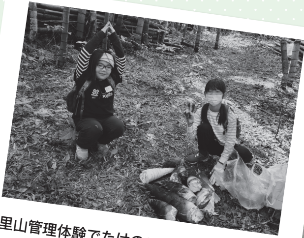
里山管理体験でたけのこポーズ！(4/16)