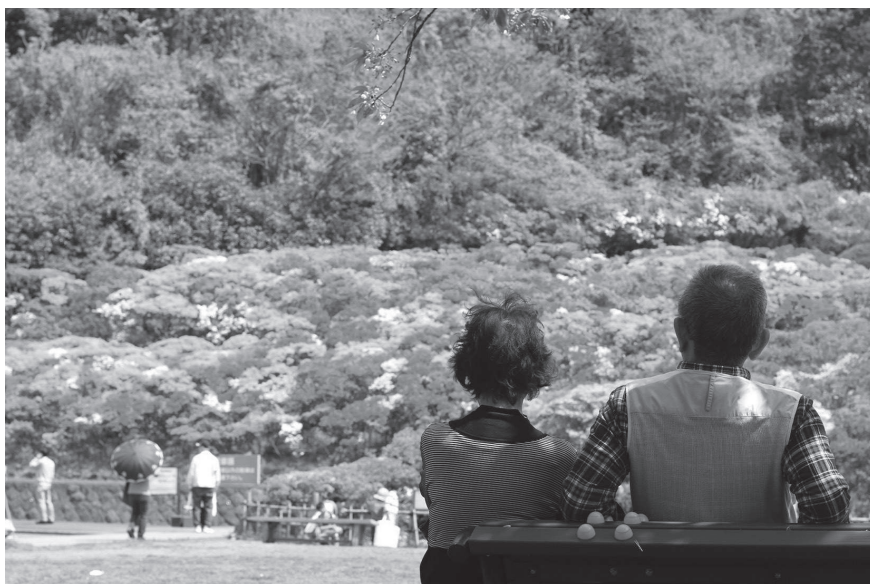
▶ いつまでもこの町で (写真は花の木公園)