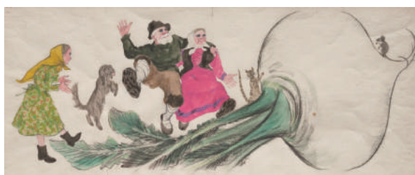
▲佐藤忠良『おおきなかぶ』絵本原画 26-27頁 1962年5月刊 紙、水彩・インク・コンテ・鉛筆 宮城県美術館蔵