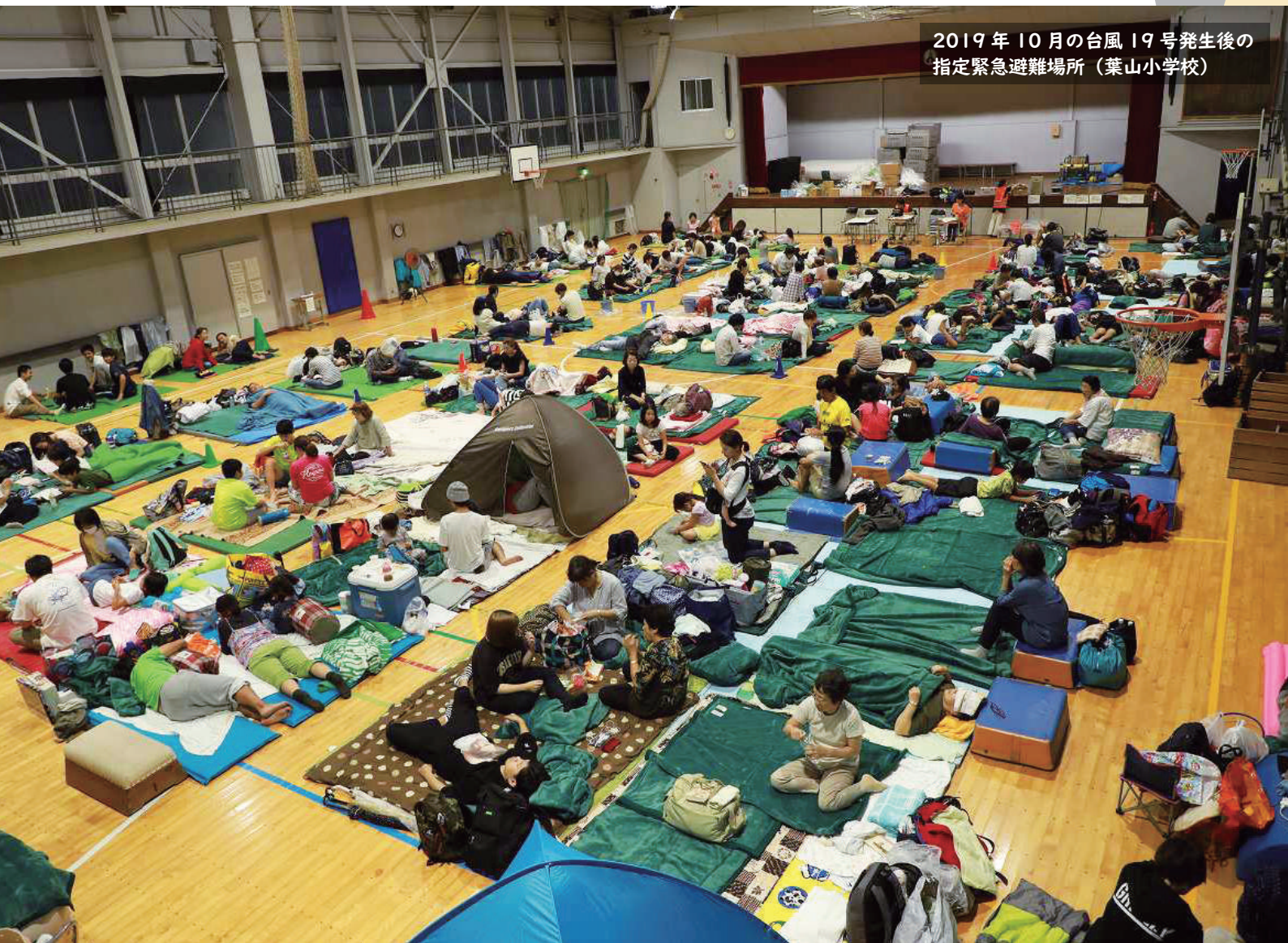
2019年10月の台風19号発生後の指定緊急避難場所（葉山小学校）

地震大国、日本。そして、近年各地で頻発する異常気象や大規模災害。 自分の命、大切な人の命を守るためにできることは……。