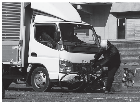
▲南郷中学校での交通安全教室