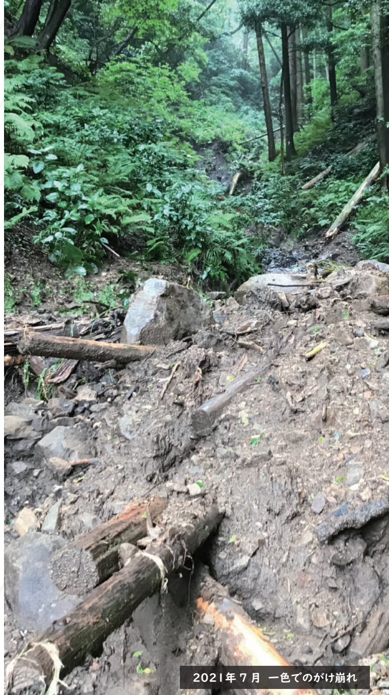
2021年7月 一色でのがけ崩れ