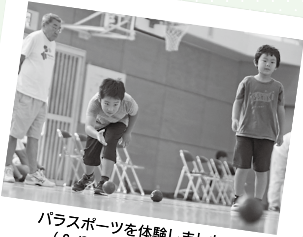
パラスポーツを体験しました！ (9/22 ボッチャ体験会)