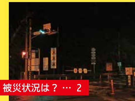
被災状況は？ … 2