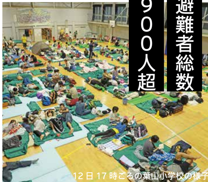
12日17時ごろの葉山小学校の様子

町の指定避難所11か所に加え、自主避難所も開設され、多くの避難者が不安な時間を過ごしました。しかし、避難所によってはファイブビーンズさんよりコーヒーの提供があったり、避難所の物品搬入や片付けをご協力いただいたりした他、株式会社スズキヤさん、ほかほか弁当葉山一色店さんから避難者への食糧のご寄付もありました。