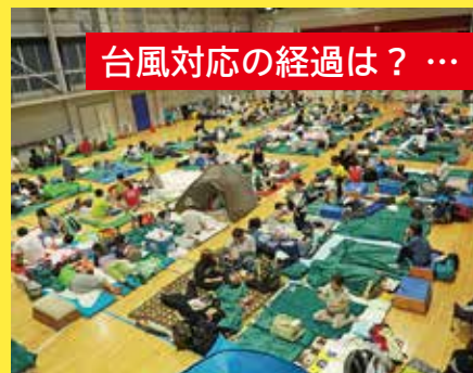
台風対応の経過は？ … 3