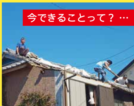
今できることって？ … 7