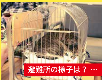
避難所の様子は？ … 4