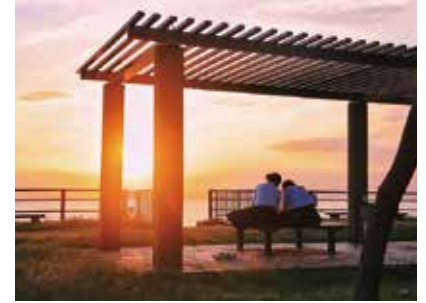
眩しいのは太陽だけじゃない (@hayama_official)

海の向こうに夕日が沈む、葉山らしい景色。県立葉山公園の芝生にあるベンチから大浜海岸の夕日を眺める学生の後ろ姿を撮影しました。空気が澄んで夕日がよりきれいに見える季節がやってくるのが楽しみです。