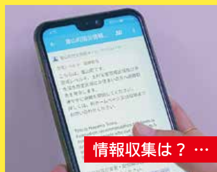
情報収集は？ … 7