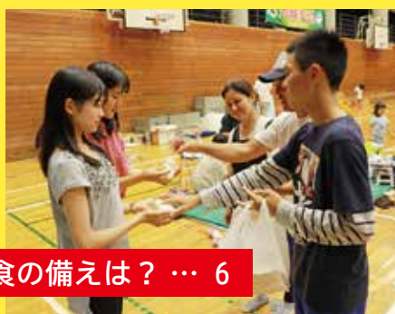
食の備えは？ … 6