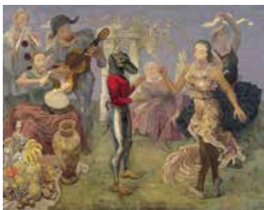
▲ 朝井閑右衛門 《丘の上》1936年 油絵具、カンヴァス 神奈川県立近代美術館蔵 (コレクション展より)