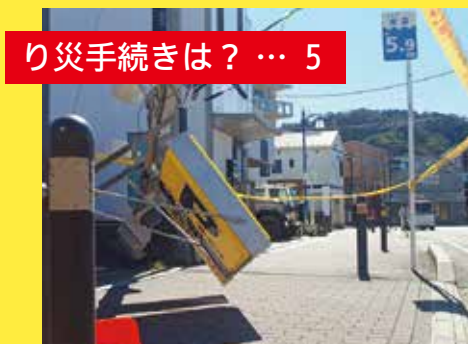
り災手続きは？ … 5