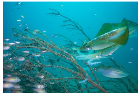
アオリイカの産卵床として使用された危険木