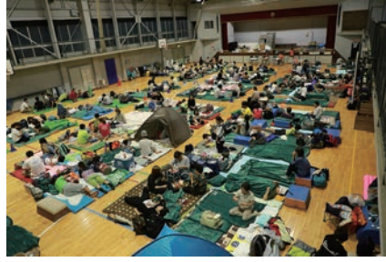
防災情報については18ページをご覧ください。

夕方5時のチャイム。時間を知らせするためでもあります。実は音がちゃんと鳴るかどうかが、私たち役場の大切なチェックなんです。あの音色は、わらべうたの「ぶっさん」や「カタツムリ」、クラ