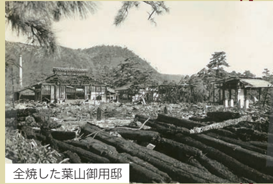
全焼した葉山御用邸