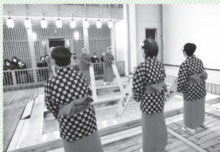
▲草津名物 熱乃湯「湯もみと踊りショー」

葉 山町の国内姉妹都市は群馬県草津町。葉山御用邸の立役者でもあり、草津温泉の恩人でもあるエルウィン・フォン・ベルツを紹介した、歴史的な深いつながりから昭和44年に姉妹都市協定を締結。当初より海の町草津での水泳教室、山の町草津でのスキー教室を中心にスポーツ・文化などで53年もの間にわたり交流を続けています。 草 津温泉は標高約1200mの高原地に広がっており、「にっぽんの温泉100選」で17年連続第1位。四季を通じてにぎわう草津町と今後も様々な連携をしていきます。