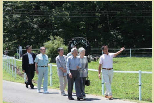
▶ 下田市への行幸啓