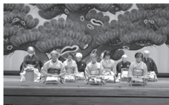
◀ 去年の葉山町文化祭の様子