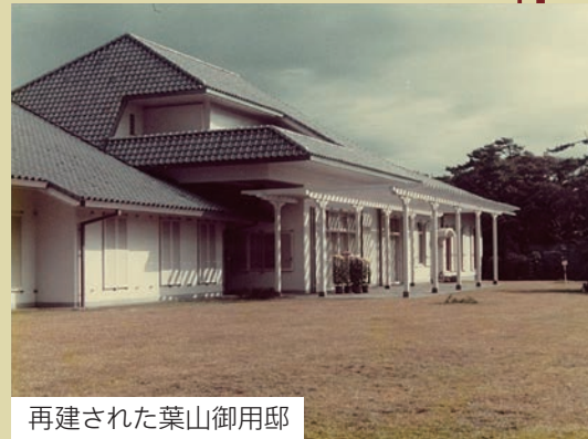
再建された葉山御用邸