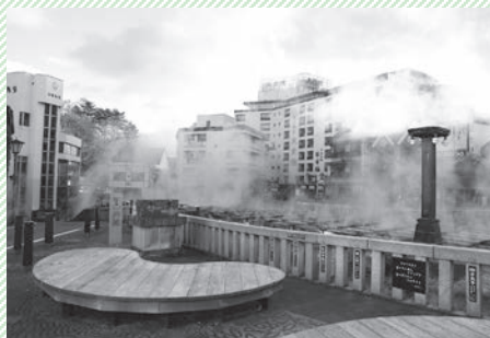
▲草津のシンボル「湯畑」