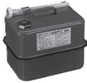
▲上から性能試験確認済証、金属製のガソリン用携行缶

○セルフスタンドでは、利用者が自ら携行缶にガソリンを給油することとは禁止されています。携行缶へ給油する際は、従業員へ声を掛けましょう。 ○ガソリンやガソリン混合油は、性能試験をクリアした金属製のガソリン用携行缶で購入してください。