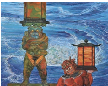
◀奥谷博《底力》 2021年 油彩、 カンヴァス 個人蔵