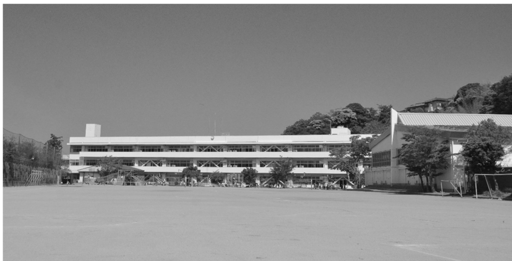
町内の小・中学校施設

□ 町は、学校施設の整備や維持管理にあたり、学校、保護者、地域住民の意向把握に努めます。