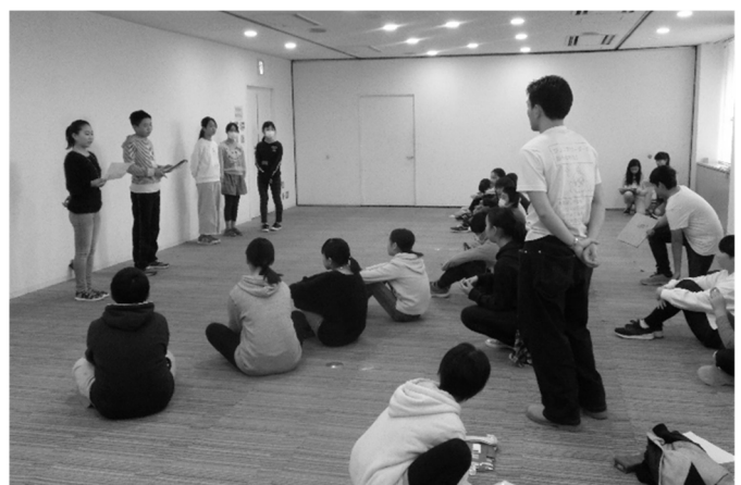
ジュニアリーダー養成講座