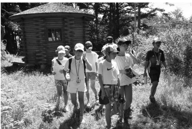
ジュニアキャンプ