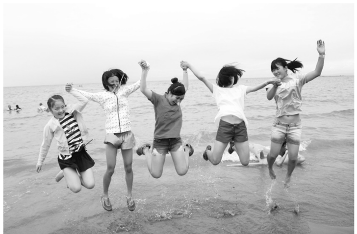
草津町親善水泳教室の様子