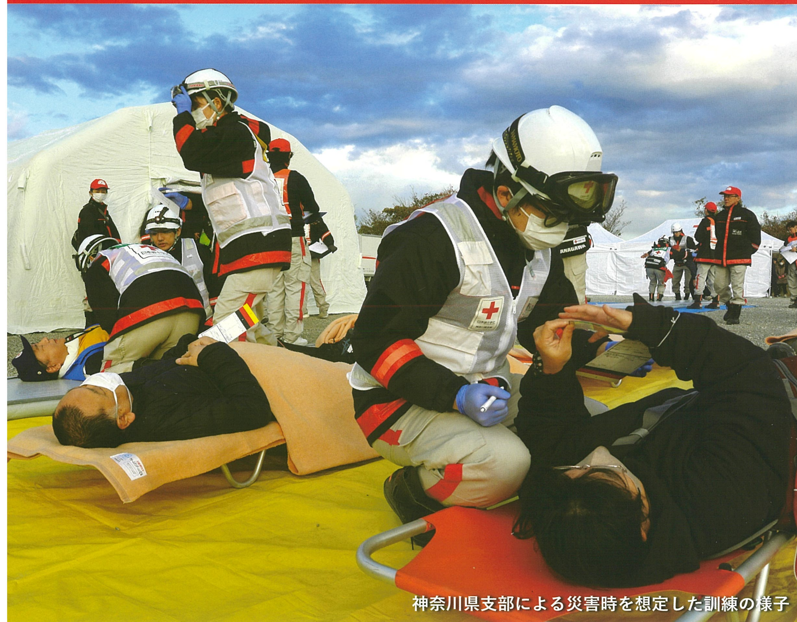
神奈川県支部による災害時を想定した訓練の様子