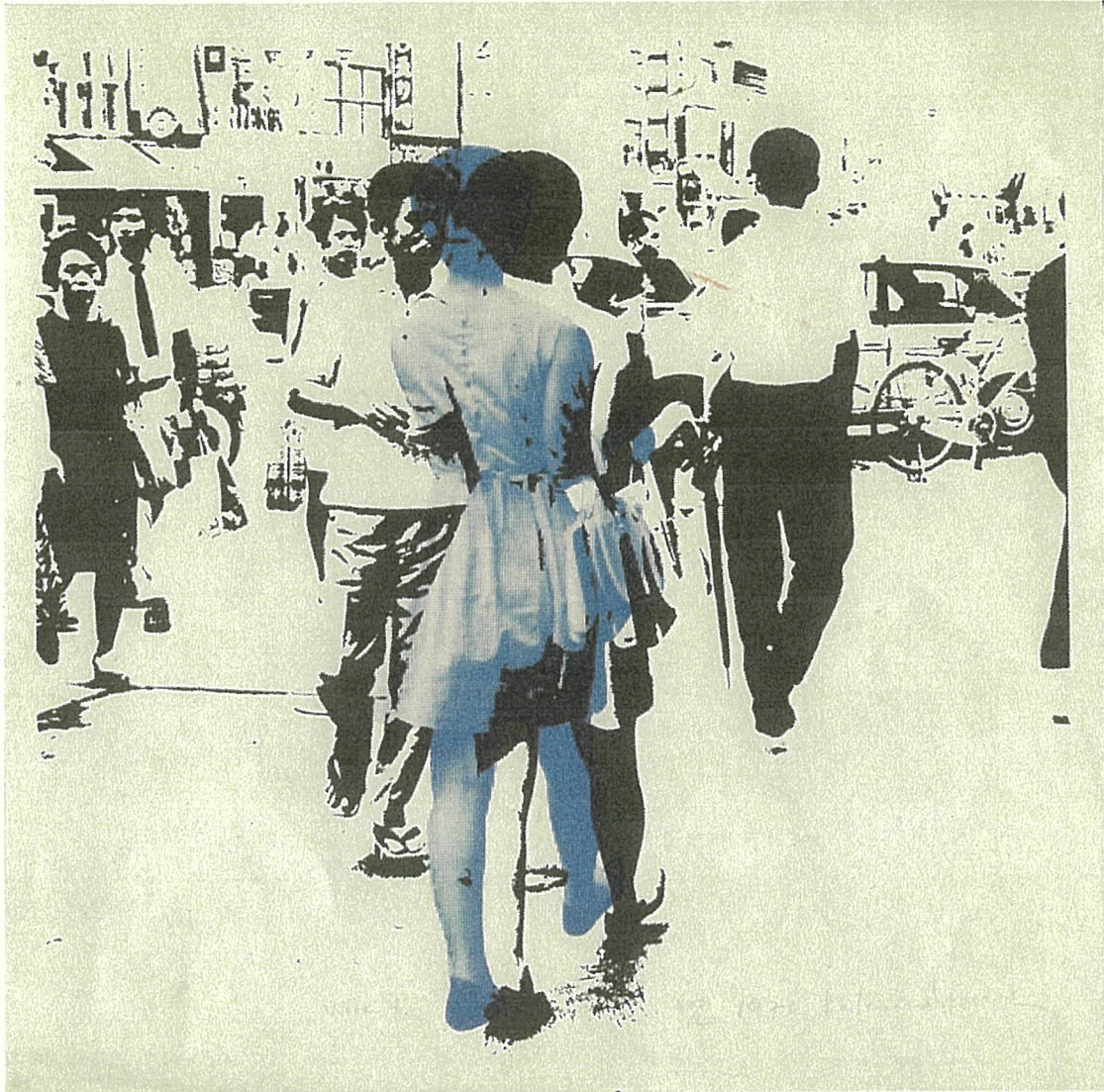
吉田克朗《Work “9”》1970年 神奈川県立近代美術館蔵

吉田克朗（よしだ・かつろう/1943-1999）は、1969年から物体を組み合わせた作品の制作を開始し、後に「もの派」と称される動向の先鞭をつけた作家のひとりです。その後、写真を用いた版面に加え、転写などの実験的な手法を試みながら絵画表現を模索し、粉末黒鉛を手指でこすりつけて有機的な形象を描く〈触〉シリーズにより注目を集め、55歳で逝去しました。本展は制作ノートなどの資料も多数紹介し吉田克朗の全貌に迫る、初めての回顧展です。