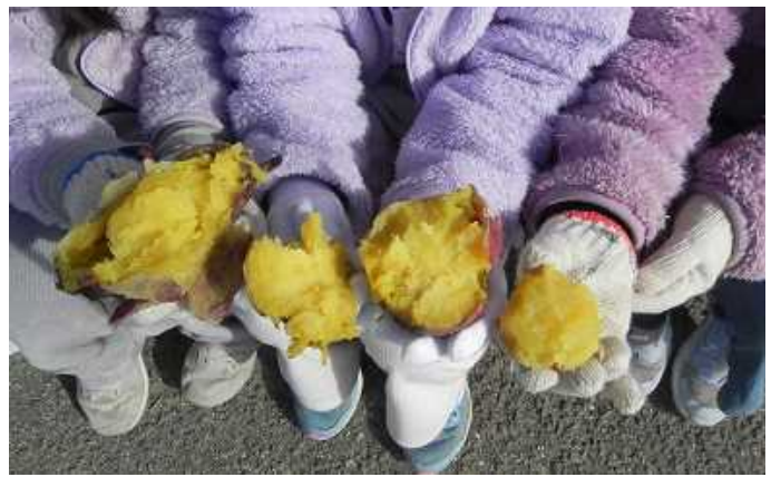
<焼き上がったお芋。おいしそう>