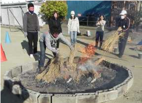
<熾火に並べたお芋の上に藁を>