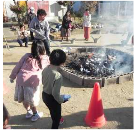
<右・熾火の中にお芋を投入>

1月10日(水)。畑で育ててきた「さつまいも」を収穫し、1年生が「やきいもづくり」を行いました。当初、年末に予定していたのですが、強風のため延期して今回の実施となりました。当日はPTAの皆さんが数多くボランティアとして参加してくださいました。おかげさまで準備から火の番、後片付けまで、とてもスムーズかつ安全に実施できたこと感謝申し上げます。着火時には燃え上がる炎に驚き、お芋を熾火(おきび)の中に投入する際は「顔が焼ける～」とその熱さを感じ、そして焼き上がったお芋の皮をむいているときには立ち上る香りを楽しみながら「おいしそう」と笑顔を見せていた子どもたち。新春の青空のもと、口いっぱいにはおぼっていました。